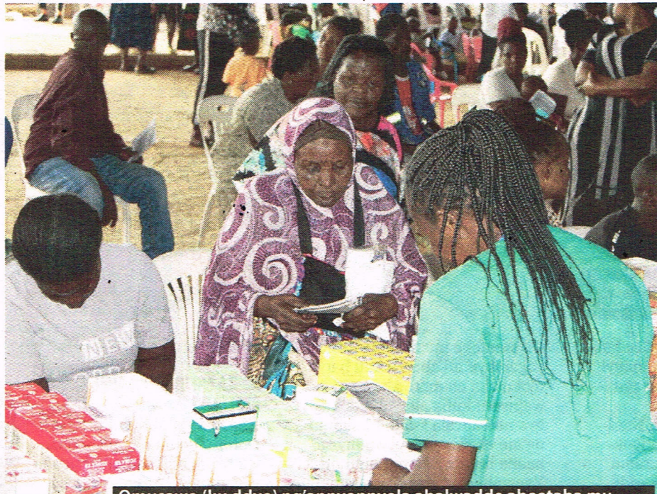
Omusawo (ku ddyo) ng'annyonyola abalwadde abeetaba mu lusiisira lw'ebyobulamu e Butabika, enkozesa y'eddagala entuufu.

● Okwewala okumira eddagala ery'amaanyi okusukka ku bulwadde bw'olina : Ebifo ebimu naddala mu bulwaliro obutonotono, bamanyi okugaba eddagala ery'amaanyi n'ekigendererwa eky'okukuba amangu obulwadde babatende okukola. Kino kibeera kya bulabe kubanga omubiri bwe