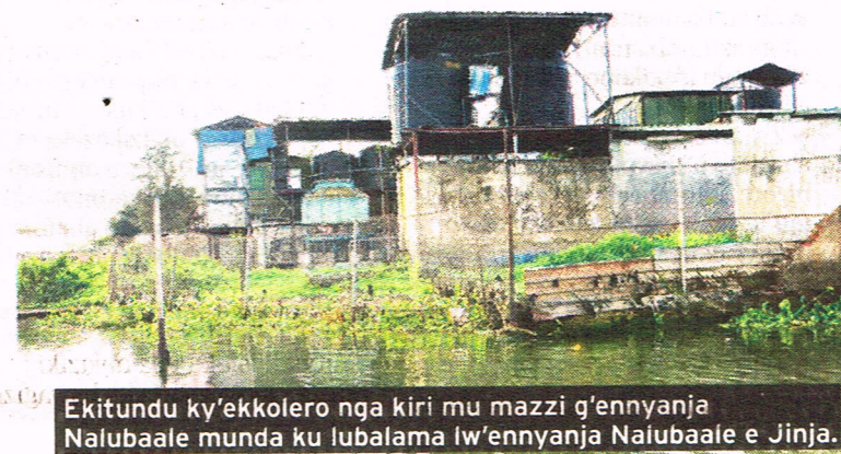
Ekitundu ky'ekkolero nga kiri mu mazzi g'ennyanya Nalubaale munda ku lubalama lw'ennyanya Nalubaale e Jinja.