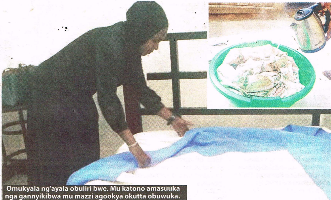
Omukyala ng'ayala obuliri bwe. Mu katono amasuuka nga gannyikibwa mu mazzi agookya okutta obuwuka.

● Ekisenge ekifumbekedde ebintu ebitalongosebwako nfuufu, n'oku-