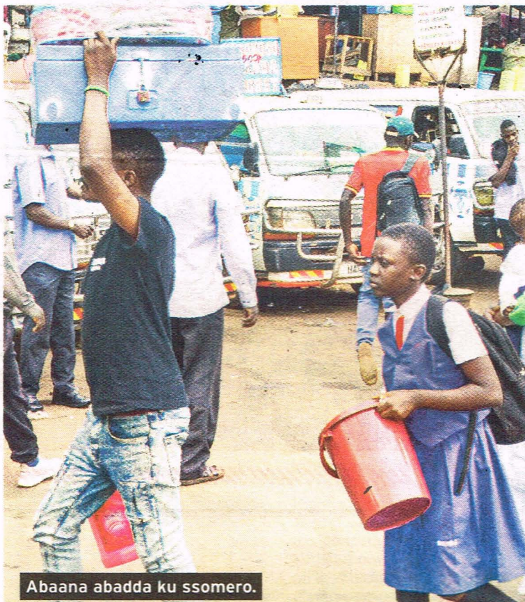
Abaana abadda ku ssomero.

Yagambye nti, ebyetaago bye yatwala ku ssomero olusoma oluwedde, kyenkaña bitandika amaka ate nga ne mu lusoma luno alina okugula ebirala ky'agamba nti kikosa nnyo ensawo ye. Mu by'alina okugula mwe muli enjeyo ezeera wabweru ne munda, bbulaasi ezinyonja mu kaabuyonjo, Jik, Ream z'empapula, ssabbuuni, ssukaali, sseente z'okulambula ezim-sabibwa buli lusoma ku baana ab'enjawulo ne kalonda omulala. Abaana b'aweerera kuliko owa S2 nga kati yaakamugulira yunifoomu za mirundi ebiri mu myaka ebiri,