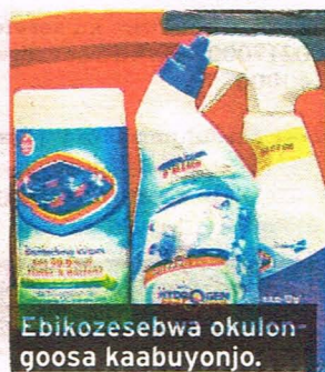
Ebikozesebwa okulon-goosa kaabuyonjo.