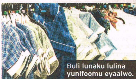
Buli lunaku lulina yunifoomu eyaalwo.